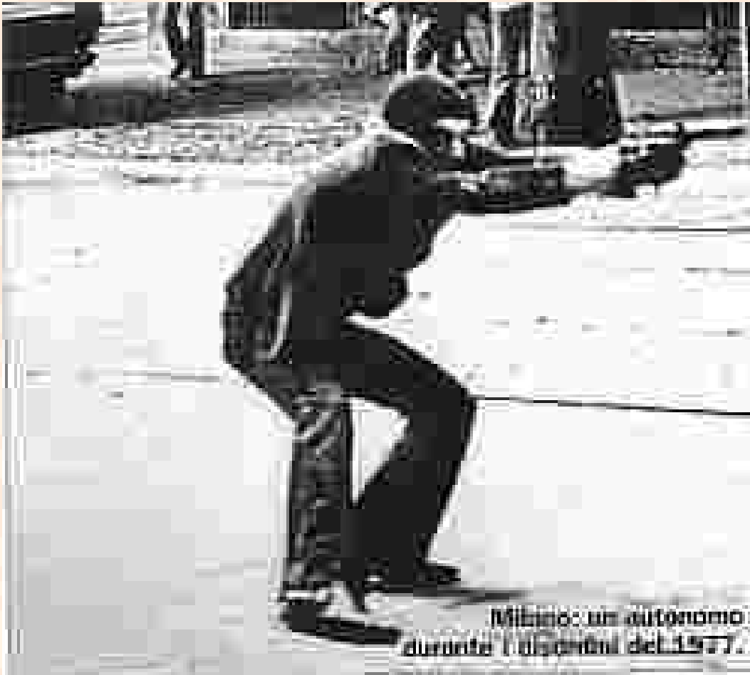
Foto simbolo degli anni di piombo, scattata durante la manifestazione in cui venne ucciso Antonio Custra