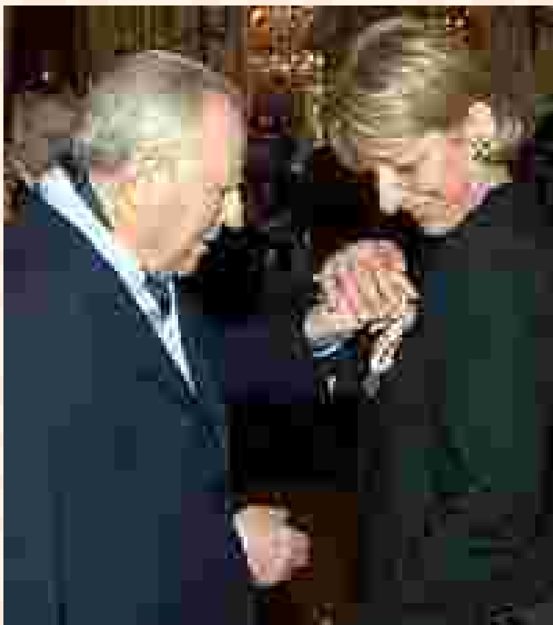
Quirinale - 14 maggio 2004 Cerimonia di consegna delle medaglie al valore